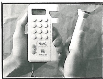
FETAL DOPPLEX, MULTI DOPPLEX MINI DOPPLEX, AUDIO DOPPLEX